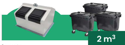
2 INKAST Motsvarar 3 st 660 L kärl

Kombinera Wave med exempelvis underjordsbehållare för en kostnadseffektiv källsorteringslösning!