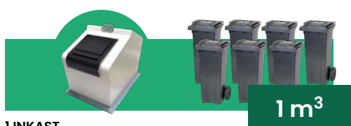
1 INKAST Motsvarar 7 st 140 L kärl

Har du behov av en källsorteringslösning för större volymer men har ont om utrymme? Wave rymmer motsvarande ett stort antal avfallskärl vilket både är platseffektivt och stilrent!