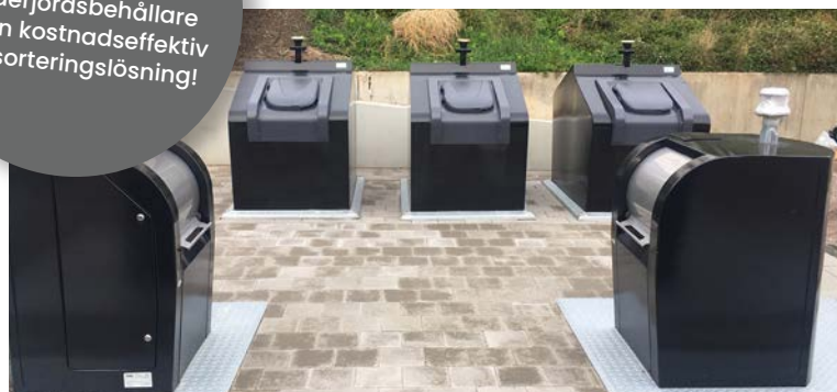
Kombinationer som framgångsfaktor, här kombineras Wave med CityCave – en helt nedgrävd underjordsbehållare.